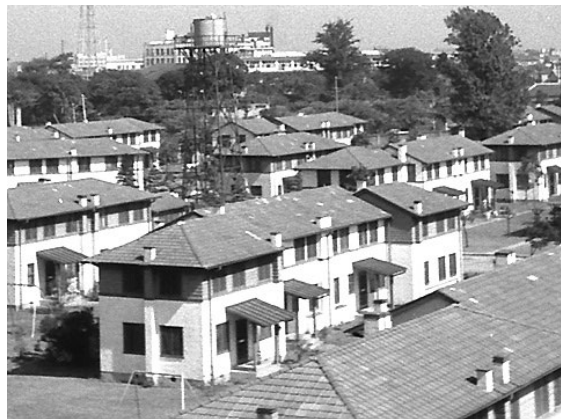
パレスハイツ（進駐軍住宅）